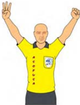
Número de los jugadores-11