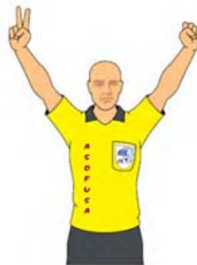
Número de los jugadores-10