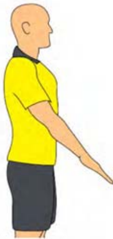
Saque de meta (1)