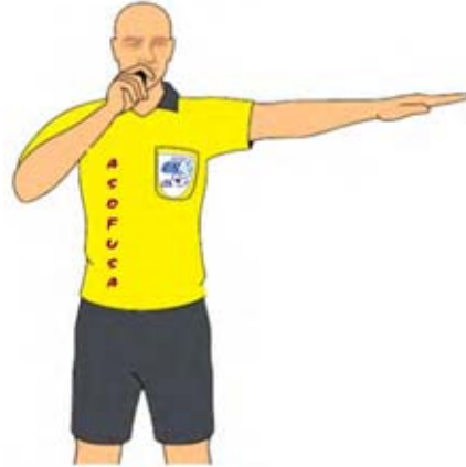
Gol en propia meta (2)