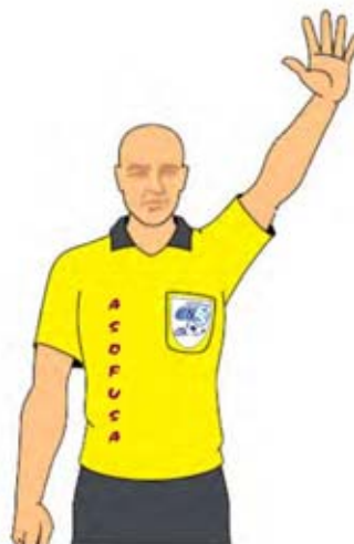
Cuenta de los 4 segundos (2)