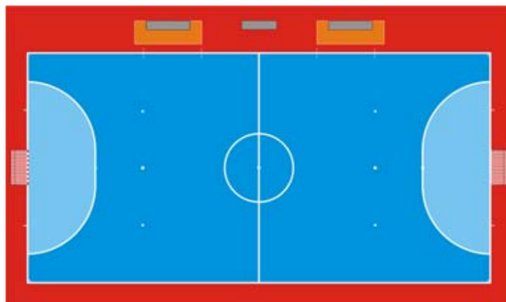
La superficie de juego

Los partidos deberán jugarse en superficies lisas, libres de asperezas y que no sean abrasivas, preferentemente de madera o de un material sintético, de acuerdo con el reglamento de la competición. Se deberán evitar las superficies de hormigón o alquitrán.