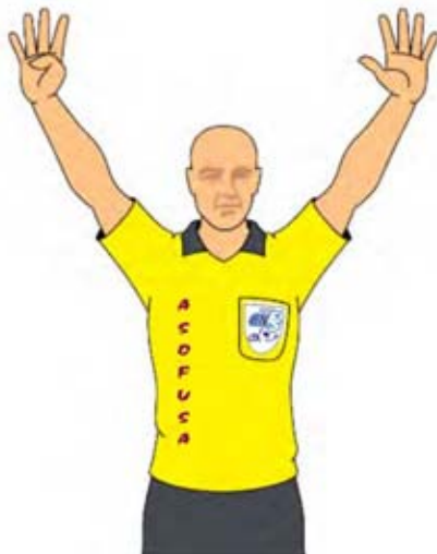
Número de los jugadores-7