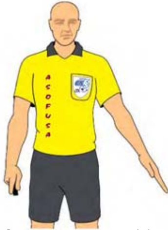
Saque de esquina (1)