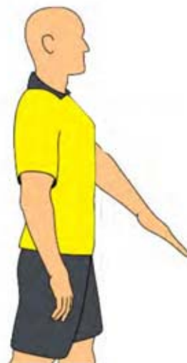
Saque de meta (2)