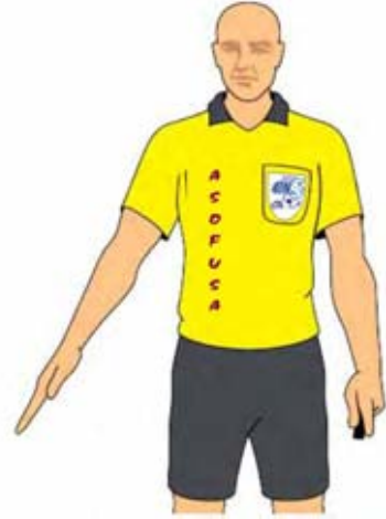
Saque de esquina (2)