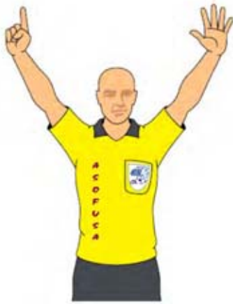
Gol en propia meta (1)