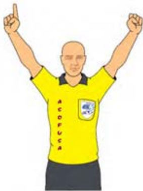
Número de los jugadores-9